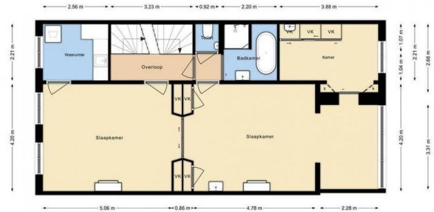
RIJWISTRAAT 79 1e verdieping Hoogte 3.00m