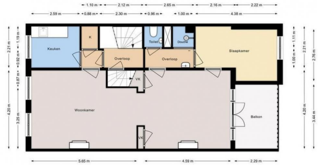
ROUWSTRAAT 79 De verdieping Hoogte 2.85m