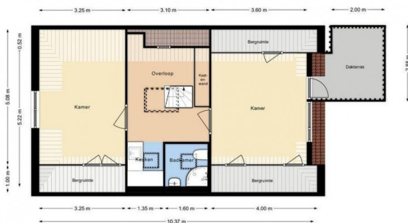
RIJLWSTRAAT 79 De verdaging Hoogte 2,103,24m