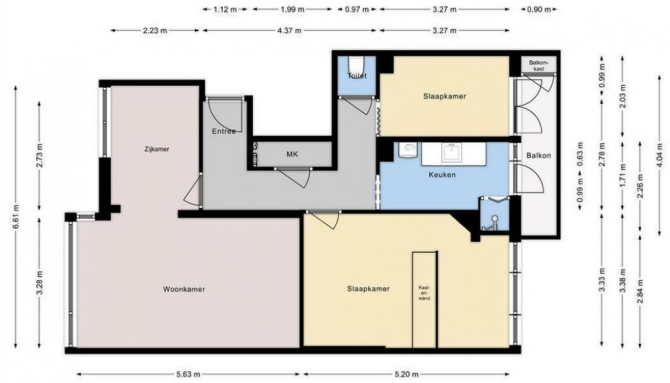
OUDEMANSSTRAAT 422 Te Verdieping Hoogte 2.54m