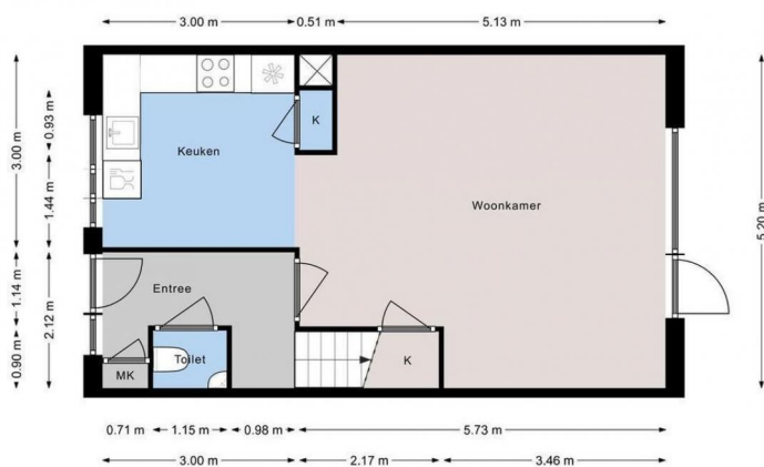
SEPIAHOF 3 | Begane grond | Hoogte 2.61m