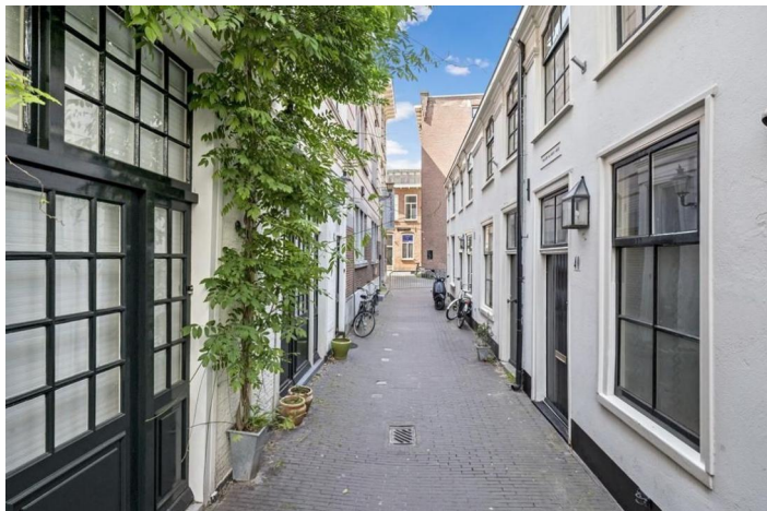
Denneweg 40, 's-Gravenhage