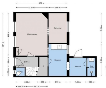
[ DELFTWEG 47 | Begane grond | Hoogte 2.75m ]