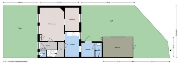
[ DELFTWEG 47 | Perceel (indicatief) ]