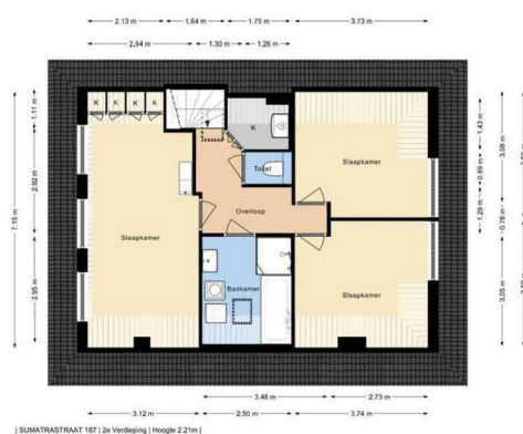
| SUMATRASTRAAT 187 | 2e Verdieping | Hoogte 2.21m |