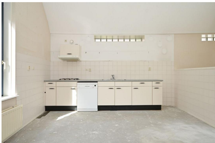
Agnietenpad 11, 's-Gravenhage