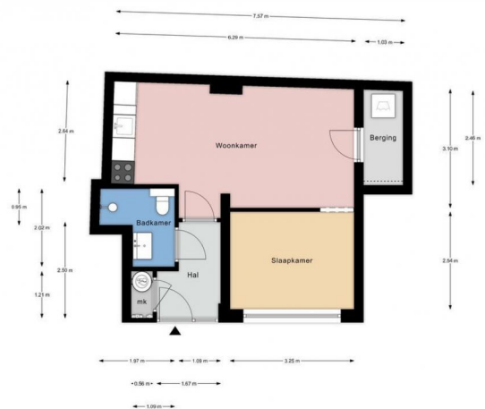
Assendelftstraat 50, 2512VW Den Haag | Begane grond H = 2,80 m