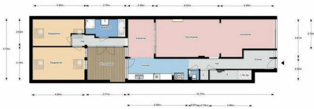
Gumstraat 189, Den Haag | Begane grond H+ 2.80 m