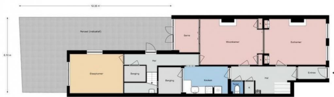
Archedestraat 72, 2517 RX Den Haag | Perceel (indicatief)