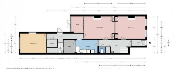
Archimedesstraat 72, 2517 NX Den Haag | Begane grond H = 3,14 m