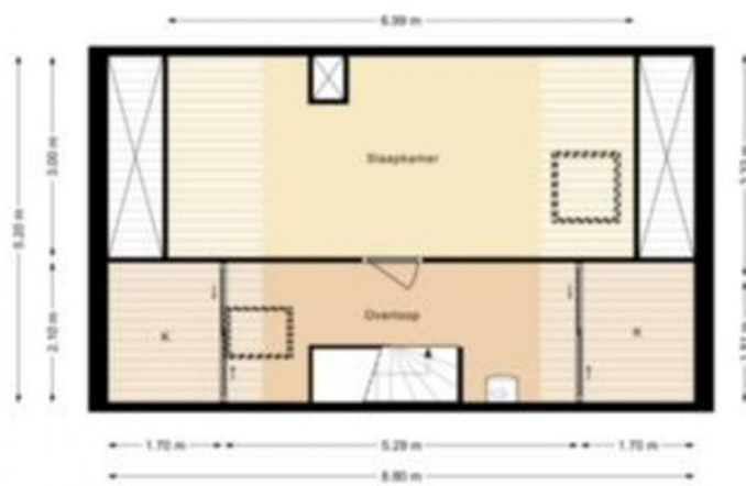
SEPIAHOF 3 | 2e Verdieping | Hoogte 2.80/0.0m