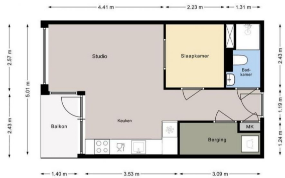
|LANGE NIEUWSTRAAT 294 | 2e Verdieping | Hoogte 2.61m |