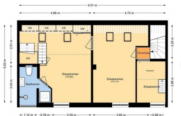
SUMATRASTRAAT 282 1e Verdieping Hoogte 3.17m