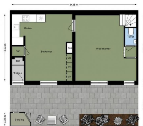
SUMATRASTRAAT 282 Perceel