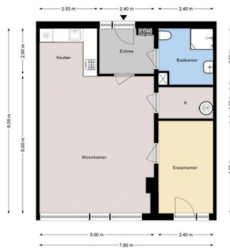
LAGE NIEUWSTRAAT 216 | Begane grond | Hoogte 2.58m |