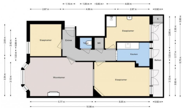
[SCHAARBERGENSTRAAT 156 | 1e Verdieping | Hoogte 2.80m]