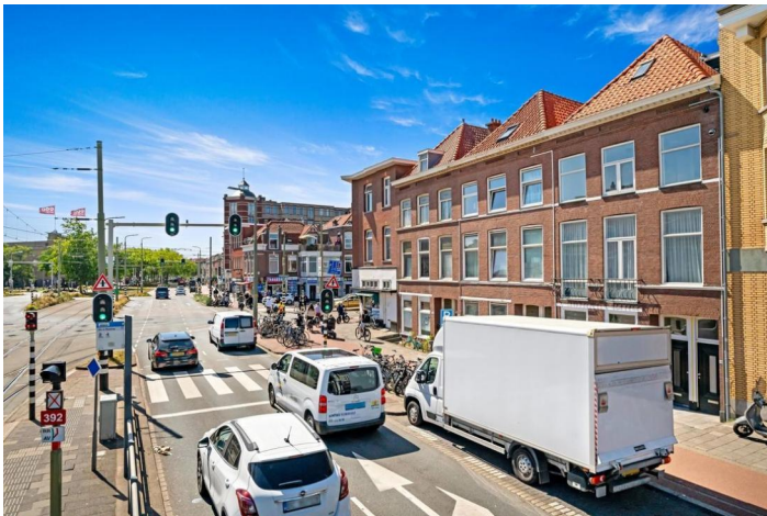
Loosduinseweg 641 A, 's-Gravenhage